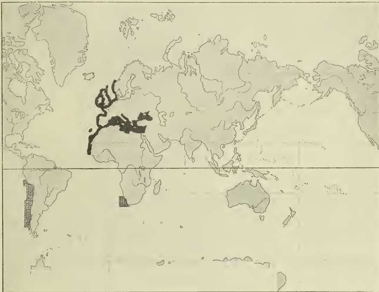
Karte 3. Verbreitung von Actinia equina ■ und Phymactis capensis ▣.

eigentümlich, doch finden sich Angehörige der Gattungen, zu denen diese 3 Arten gehören, auch in den europäischen Gewässern. Die Kanarischen Inseln haben mit dem Litoral des europäischen Festlandes nur noch Actinia equina gemein; dagegen besitzen sie in Palythoa canariensis eine endemische Form, die am nächsten mit der P. isolata von den Bahama-Inseln verwandt ist. Die im systematischen Teile der Arbeit als neu beschriebene Euphelia cinclidifera steht vorläufig wenigstens isoliert. Den äußersten Süden des nordwestafrikanischen Gebietes nehmen die Kapverden ein, an deren Gestade die Südgrenze der Verbreitung von Actinia equina und wahrscheinlich auch von Adamsia rondeletii liegt. Sie beherbergen bereits in Phymactis diadema den Vertreter einer Gattung, die den nördlicheren Teilen des Atlantischen Ozeans durchaus fremd ist. Cereus brevicornis ist auf die Umgebung der Kapverden beschränkt.