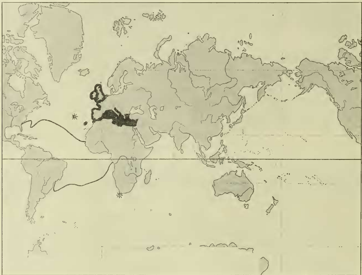
Karte 1. * Verbreitung der Gattung Epizoanthus an der westafrikanischen Küste. ■ Verbreitung von Anemonia sulcata . — Marine Oberflächenisotherme von 20° im kältesten Monat im Atlantischen Ozean nach SUPAN.

ordentlich ungleichmäßig. Die Cerianthaceen sind mit nur einer Art vertreten, die sich ausschließlich im äußersten Norden des westafrikanischen Küstengebietes (Madeira) findet. Auf die Unterordnung der Actiniaceen entfallen 17 Spezies, die sämtlich der Tribus Actiniinae angehören. Wenn man auch als sicher annehmen darf, daß mit der fortschreitenden Erforschung der westafrikanischen Küste noch stichodactyline Aktinien aufgefunden werden, so dürfte doch mindestens eine gewisse Armut an Stichodactylinen auch in Zukunft als das Wahrzeichen der westafrikanischen Fauna gelten. Die Actiniinen sind wahrscheinlich ziemlich gleichmäßig über die ganze westafrikanische Küste verbreitet. Von den Zoanthaceen kommen hier 9 Arten 1) vor, und zwar finden sich im tropischen Westafrika nur Angehörige der Subfamilie Brachycneminae, während im Norden (Azoren, Kanaren) wie im Süden (Kapland) neben Brachycneminen auch Macrocneminen auftreten. Jeder Versuch einer faunistischen Gliederung Westafrikas wird diesem Umstande Rechnung zu tragen haben und somit eine Dreiteilung der Küste vornehmen, wie sie bereits im systematischen Teile der Arbeit durchgeführt worden ist.