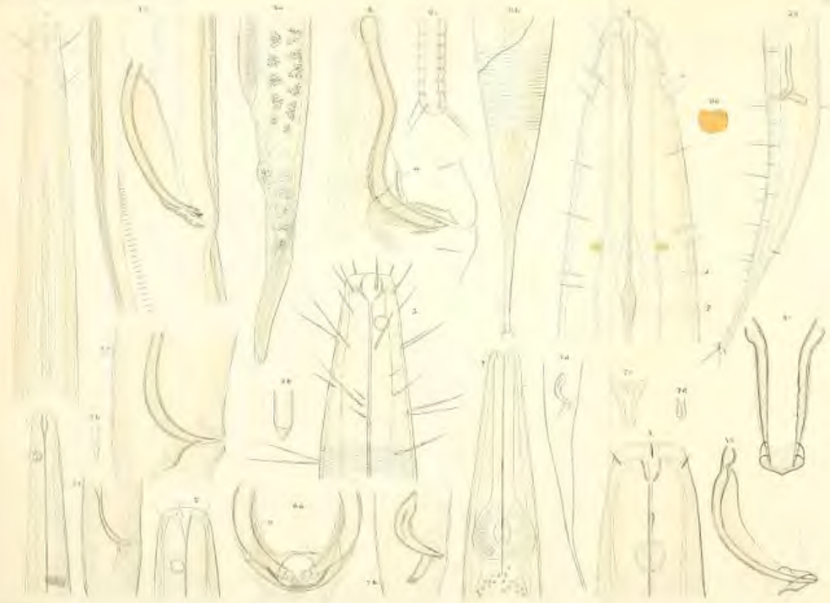
Fig 1. Dalmanella gracilis n. sp. Fig 2. Dalmanella gracilis n. sp. Fig 3. - - - - - Fig 4. - - - - - Fig 5. - - - - - Fig 6. Dalmanella gracilis n. sp. Fig 7. Dalmanella gracilis n. sp. Fig 8. Dalmanella gracilis n. sp. Fig 9. Dalmanella gracilis n. sp. Fig 10. Dalmanella gracilis n. sp. Fig 11. Dalmanella gracilis n. sp. Fig 12. Dalmanella gracilis n. sp. Fig 13. Dalmanella gracilis n. sp. Fig 14. Dalmanella gracilis n. sp. Fig 15. Dalmanella gracilis n. sp. Fig 16. Dalmanella gracilis n. sp. Fig 17. Dalmanella gracilis n. sp. Fig 18. Dalmanella gracilis n. sp. Fig 19. Dalmanella gracilis n. sp. Fig 20. Dalmanella gracilis n. sp.