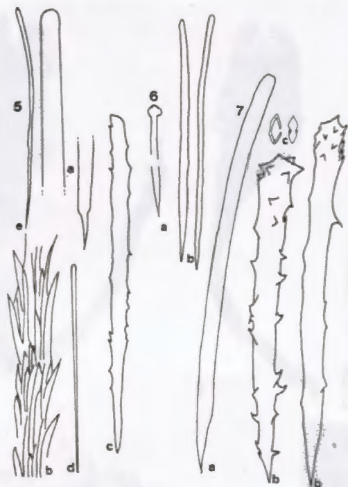
Figs. 5-7.— 5: Clathria lipochela Burton, 1932. a: estilo principal, b: haz de estilos, c: acantostilos, d y e: subtilostilos; 6: Suberites tortuosa Lévi var. austral nov. var. a: tilostilo, b: estilo; 7: Clathria terra-novae Dendy. a: estilo, b: acantostilo, c: isoquela.

Discusión. Burton (1932) transfiere las especies de las islas Georgias al género Microciona , al encontrar caracteres indefinidos en su esqueleto que, en los ejemplares de bahía Creek, es típicamente reticulado; tanto los estilos como los pequeños acantostilos accesorios erizan la superficie y los haces internos. Los caracteres mencionados convalidan la denominación original de Dendy (1924), para los ejemplares aquí analizados.