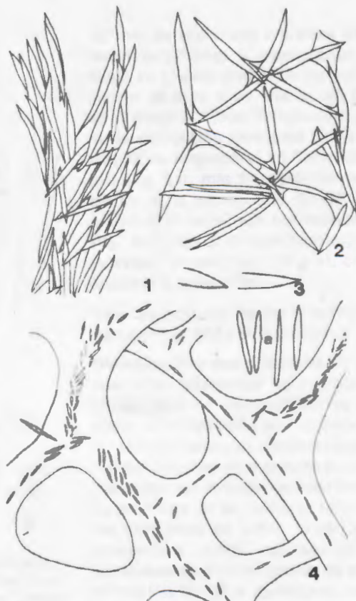
Figs. 1-4.— 1-3: Reniera pedunculata sp. nov. 1: Haz espícula fibrilar del pedúnculo; 2: Trama del esqueleto dérmico; 3: Detalle de oxeas; 4: Callyspongia fusifera (Thiele), esqueleto coanosómico; a: detalle de oxeas.

Forma típicamente arborescente, color castaño claro en formol; altura del ejemplar 4 cm, con ramificaciones de 5 mm de diámetro, algunas de las cuales se aplanan y toman forma de abanico (fig. 12). La superficie está erizada por estilos