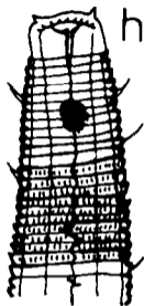
Neochromadora (N.) brevisetosa , extremo cefálico macho i. N. (N.) b. , macho